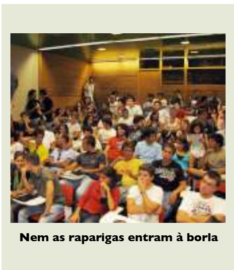
Nem as raparigas entram à borla

Diz-se que são as ideias que movem o mundo... No Técnico, estas não precisam de chão: neste momento, precisam de tecto.